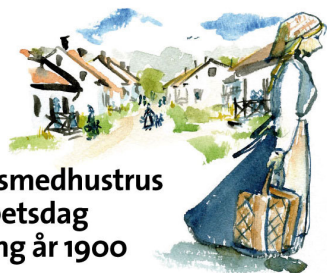
En smedhustrus arbetsdag kring år 1900

Kvinnorna levde i allmänhet i deras skugga.